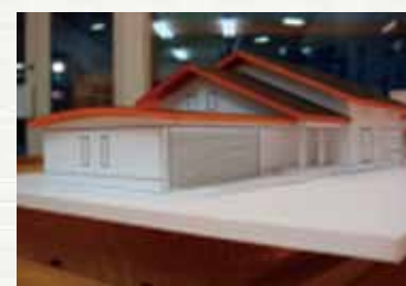
打ち合わせ途中の模型

きちんとした性能を確保して…おしゃれたデザインと空間をプラスして…家づくりをしてみませんか…。